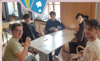
A marzo 2026 si è svolto un torneo di Mau-Mau per tutti. Torneo inclusivo con gli studenti dello studentato Kolping