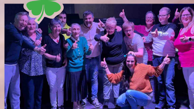
Balliamo insieme contro la solitudine uno degli eventi annuali che ci sta molto al cuore, venite e partecipate tutti.

Con il prezioso contributo della Cassa Raiffeisen Wipptal